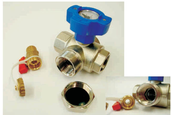
Abb: Multifunktionshahn 1" zu KFE-Hahn. Die mächtige Austrittsöffnung ist die Grundlage für zeitsparende Inbetriebnahme und Wartung