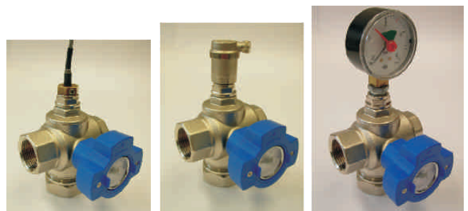
Abb: Multifunktionshahn 1" mit unterschiedlicher Belegung an der vierten, kleinen Öffnung.