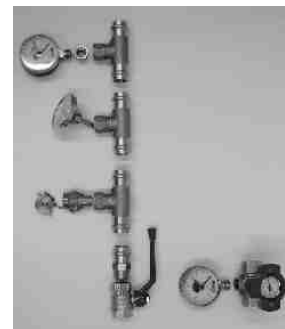
Abb: Vergleich "Konventionell" zu "Multifunktionshahn"