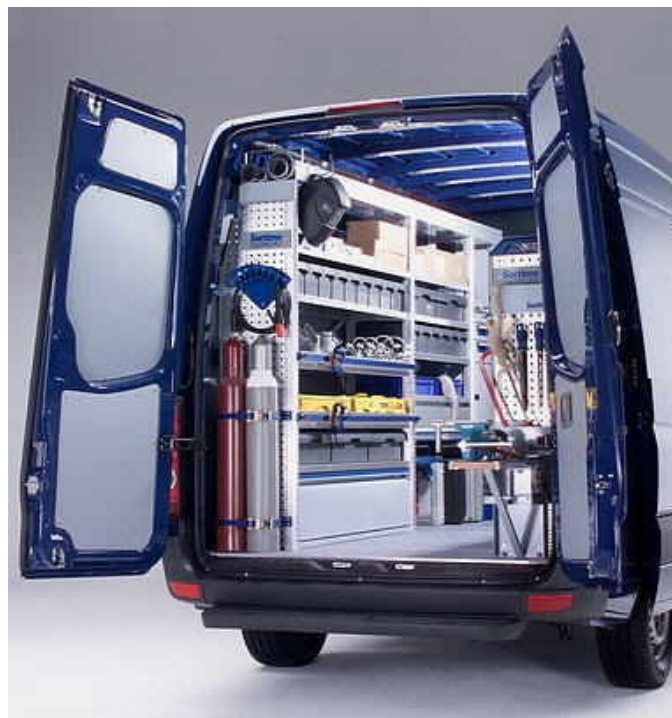
Fa. Sortimo International GmbH